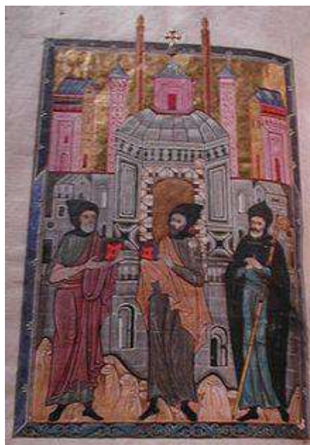
Evagrio Pontico, Giovanni Climaco e un santo sconosciuto in un'icona del XVII secolo.

Il diacono Evagrio, che è il primo tra i monaci che abbia lasciato una notevole eredità letteraria e, tra gli eremiti d'Egitto, lo scrittore ecclesiastico più fecondo e originale, occupa una posizione centrale nella storia del movimento monastico e della tradizioni ascetica. Il card. Michele