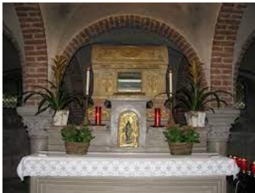
Cripta e tomba di Severino Boezio Basilica di S. Pietro in Ciel d'Oro- Pavia

Secondo lo storico Procopio di Cesarea (490ca.-565ca.), Teodorico si pentì e pianse per il male fatto a Boezio ( De Bello gotico , V,1). Dopo la morte dell'imperatore, avvenuta a Ravenna il 30 agosto 526, il venerato corpo del senatore romano Severino Boezio, che giustamente fu definito "l'ultimo romano e il primo scolastico", venne sepolto a Pavia, nella cripta della Basilica di S. Pietro in Ciel d'Oro.