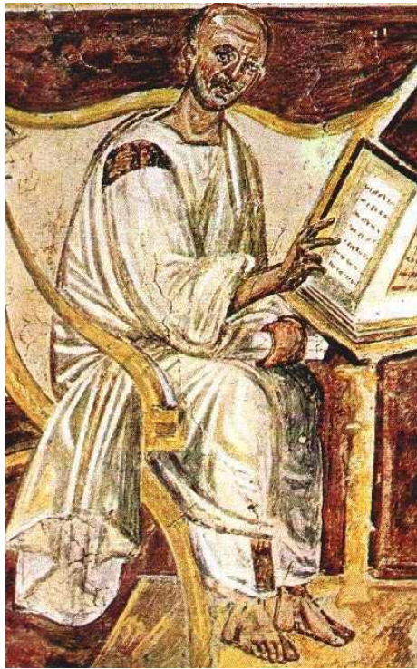
La più antica immagine di sant'Agostino d'Ippona, è un affresco del 600 circa, su una parete della Biblioteca istituita da Gregorio Magno nel vecchio Palazzo del Laterano, dove oggi si trova la Scala Santa,

Louis Marie Olivier Duchesne (1843-1922), presbitero e insigne storico della Chiesa, scrisse che Agostino, vescovo d'Ippona, «dalla sua lontana Africa si è irradiato su tutta la cristianità. Disse agli uomini del suo tempo tutte le parole adeguate. Seppe mostrar loro le proprie anime, consolarli delle sventure del mondo, guidare il loro pensiero attraverso i misteri. Era affabile con tutti. Placò i fanatici, illuminò gli ignoranti, mantenne i pensatori nel solco della tradizione. Fu il maestro di tutto quanto il Medioevo, e ancor oggi, dopo l'inevitabile logorio di un tempo così lungo, egli resta la principale autorità teologica, ed è per mezzo suo, soprattutto, che noi conosciamo l'antichità cristiana. Per certi aspetti, egli appartiene a tutti i tempi. La sua anima – e che anima! – è passata nei suoi scritti e ci vive ancora: su certe sue pagine si spargeranno sempre lacrime... » (L. Duchesne, Histoire ancienne de l'Église , Paris, A. Fontemoing & C., vol. III, 1910, p. VIII).