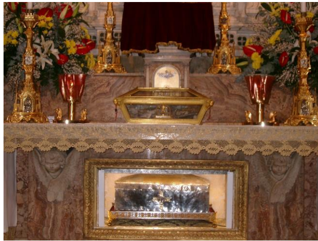
L'Arca marmorea di Sant'Agostino, capolavoro della scultura lombarda del 1362 custodisce le spoglie di Sant'Agostino d'Ippona - Basilica di San Pietro in Ciel d'Oro a Pavia.

In una lettera a San Bernardo da Chiaravalle (1090-1153), Pietro il Venerabile, abate benedettino di Cluny (1092-1156), a cui di deve la prima traduzione del Corano, definisce Agostino «massimo edificatore di Chiese dopo gli Apostoli». Se è indubbio che certi suoi insegnamenti hanno provocato aspre reazioni, il suo pensiero è comunque divenuto la sostanza della letteratura cristiana ed è rimasto per secoli presente in tutte le battaglie dello spirito.